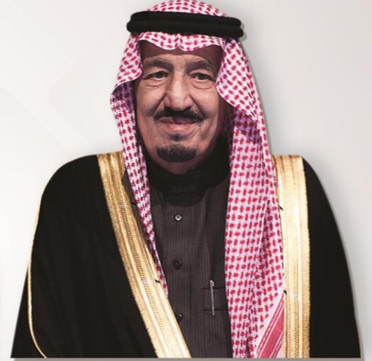
الملك سلمان بن عبد العزيز آل سعود