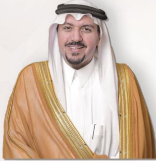
صاحب السمو الملكي الأمير الدكتور فيصل بن مشعل بن سعود بن عبد العزيز آل سعود