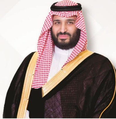
صاحب السمو الملكي الأمير محمد بن سلمان بن عبد العزيز آل سعود