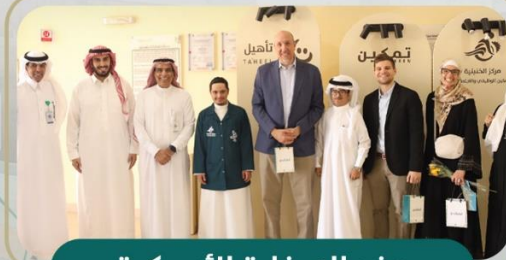
وفد السفارة الأمريكية