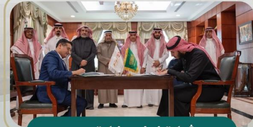
شركة لولو ماركت