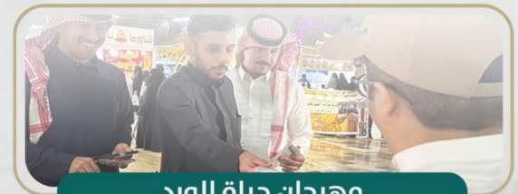
مهرجان حياة الورد