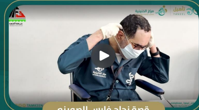
قصة نجاح فارس الصوينع