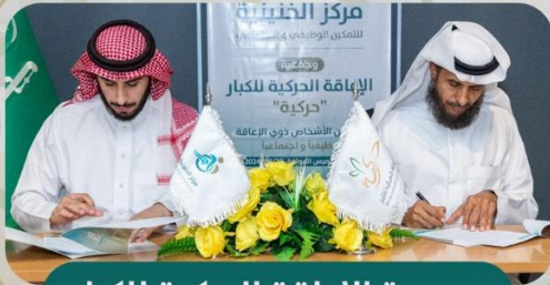
جمعية الإعاقة الحركية للكبار