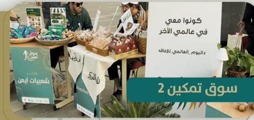
كونوا ممي في عالمي الآخر و اليوم العالمي للإعاقة

فعالية سوق تمكين بنسخته الثانية بمناسبة اليوم العالمي للأشخاص ذوي الإعاقة وبمشاركة أبطالنا المبدعين وبهدف السوق إلى تمكين أبطالنا من خوض تجربة تجارية حقيقية وابتكار طرق تسويقية لمنتجاتهم بكل احترافية