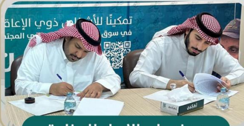
مصنع باب الإبداع للصناعة